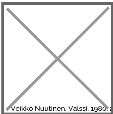
Veikko Nuutinen, Valssi, 1980, 2020, alumiini